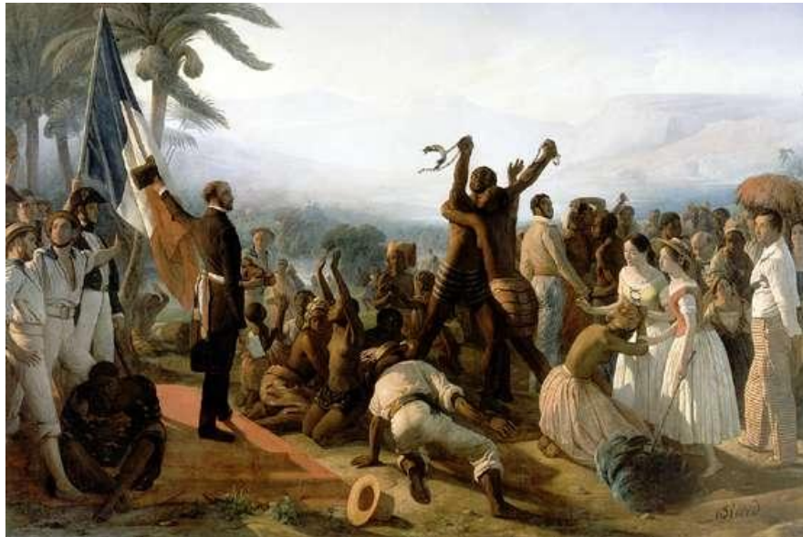
A- François-Auguste Biard, L'abolition de l'esclavage dans les colonies françaises (27 Avril 1848) , huile sur toile, 261 cm x 391 cm, 1849, Musée national du château de Versailles.